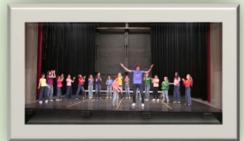
Cast Uni beet de spits af!