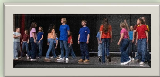
Daarna was het de beurt aan cast Damul